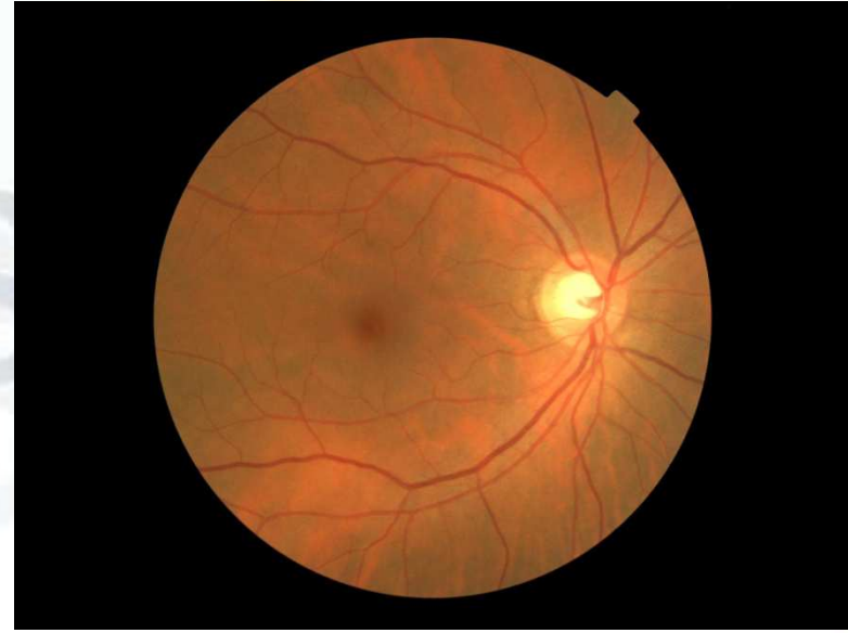
Imagen con dilatación